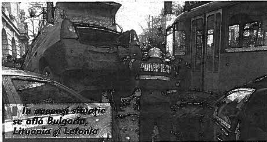
În asemenea situație se află Bulgaria, Lituania și Letonia

Executivul comunitar atrage însă atenția că după doi ani de scădere semnificativă a numărului de persoane care au decedat în accidente rutiere pe drumurile europene, cifrele pentru anul trecut sunt dezamăgitoare. În 2014, comparativ cu 2013, numărul de decese din accidente rutiere a scăzut cu aproximativ 1% după scăderi de 8% în 2012 și 2013. Situația este similară în cazul României, unde