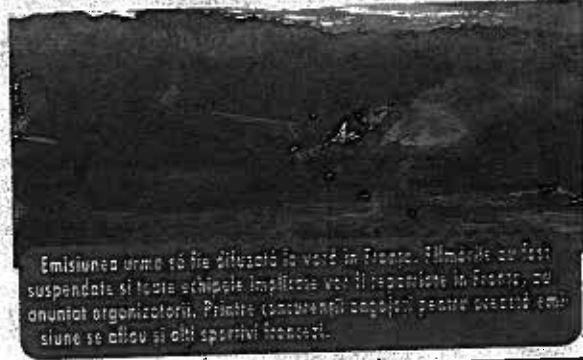
Emissiunea urma să fie difuzată în vârstă în Franța. Filmările au fost suspendate și toate echipele implicate vor fi repatriate în Franța, cu anunțul organizatorilor. Printre concurenții abajați pentru această emisiune se aflau și alți sportivi francezi.