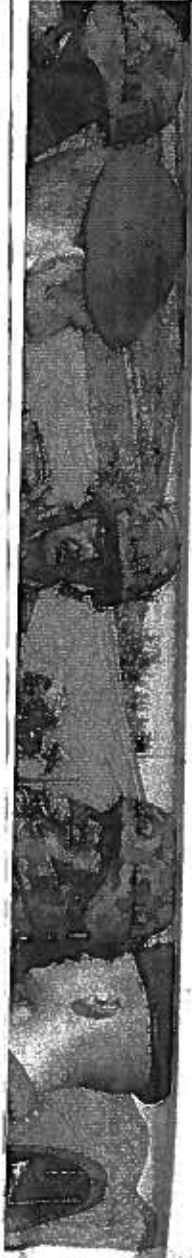
gante militare de baza, astfel încât să și poată apăra țara în eventualitatea unei invazii rusești. Înființat, guvernul de la Varșovia a s-a distanțat de aceste miliții neoficiale, dar odată cu spori- reau preocupării față de intențiile Mos-

Prin intermediul Strategiei Naționale pentru Agenda Digitală, până în anul 2020, ne propunem ca investițiile în domeniul IT&C să ajungă la 3,9 miliarde de euro, iar impactul direct asupra economiei se traduce printr-o creștere în PIB de 13%. De asemenea, întinm o creștere de 11% a numărului de locuri de muncă, în timp ce costurile de administrare vor scădea cu 12%. Fără competențe digitale nu ne putem atinge scopurile din Agenda Digitală 2014-2020", a spus Ioniță.